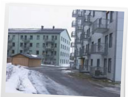
2024: Här på Getberget står Skebos senaste nybyggnation.