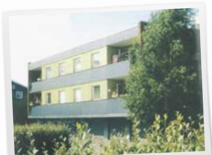
1966: Här på Snickarevägen i Ersmark byggde Skebo sitt först hyreshus.